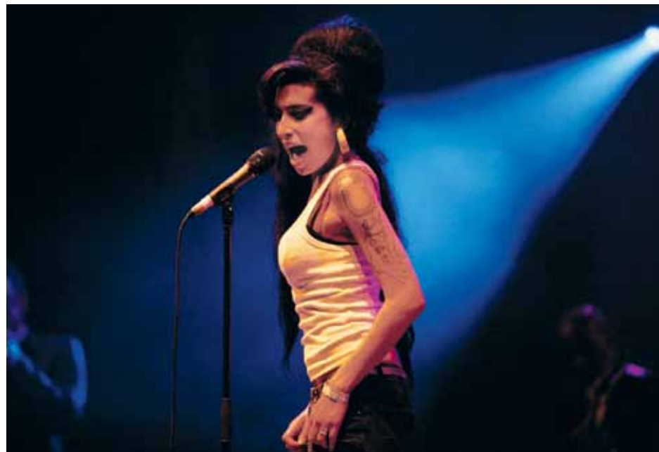
Amy Winehouse all'Eurockéennes nel 2007.

Occasione per il MAT di coinvolgere non solo gli allievi del corso di recitazione ma anche insegnanti e allieve del corso di canto con la produzione originale di interessanti cover della precorritrice del “soul bianco”.