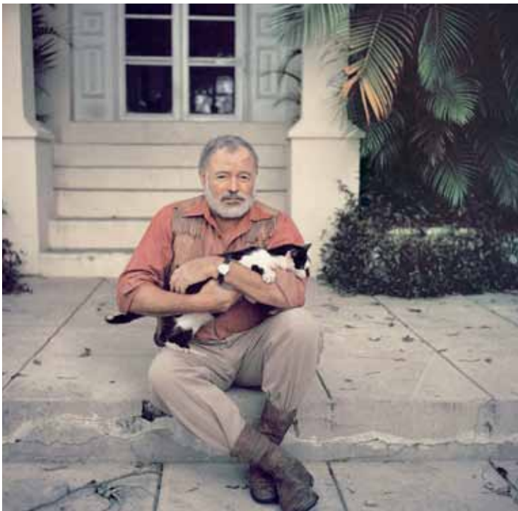
Ernest Hemingway ritratto dal fotografo Hans Malmberg, Cuba, 1954.

Anche se i mesi estivi richiamano tradizionalmente il viaggio, l'aria aperta, RSI non si dimentica di chi approfitta di questi giorni caldi e di vacanza per gustarsi i migliori film e documentari sui nostri canali.