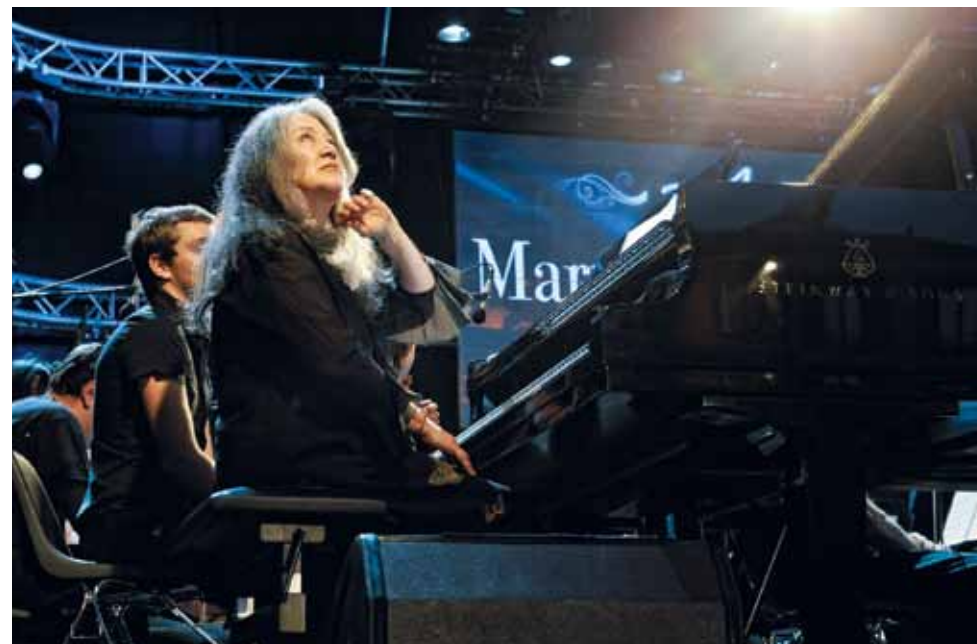
Martha Argerich and Friends a Estival Jazz 2011.

Non sappiamo come il 5 giugno la pianista “svizzera” Martha Argerich festeggerà il suo ottantesimo compleanno, ma sappiamo come lo festeggerà la Rete Due della RSI, e lo farà con una nutrita serie di omaggi, a cominciare dalle puntate di Arabesque del 3 e del 10 giugno alle 11.00 (con replica il 5 e il 12 alle 17.00) in cui a parlare sarà la stessa Argerich: dovrei essere invitato a incontrarla nelle prossime settimane, ma nel caso non dovesse essere possibile proporrò nel mio programma una serie di preziosi ascolti e frammenti delle interviste realizzate da colleghi radiotelevisivi nel corso del Progetto Martha Argerich .